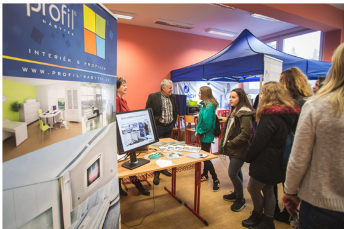
7. 11. 2017 Veletrh firem a pracovních příležitostí