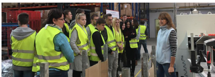
22. 11. 2017 Exkurze studentů OA Pelhřimov do místních firem